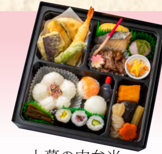
No.912 上幕の内弁当 21.6×21.6cm 税込 2,090 円 (本体価格 1,900 円)