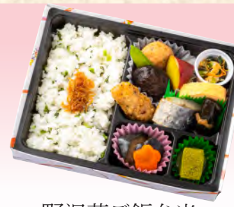
No.922 野沢菜ご飯弁当 21.6×16.5cm 税込 1,100 円 (本体価格 1,000 円)