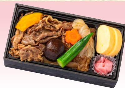
No.906 淡路牛の牛めし弁当 20.6×11.0cm 税込 1,650 円 (本体価格 1,500 円)