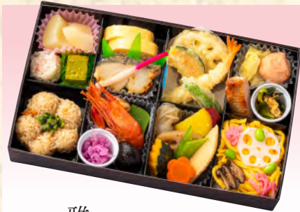
No.908 雅 28.6×17.2cm 税込 3,080 円 (本体価格 2,800 円)