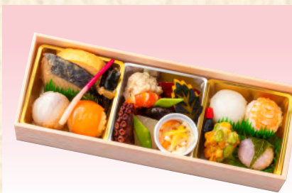
No.901 花こまち 26.5×9.5cm 税込 2,530 円 (本体価格 2,300 円)