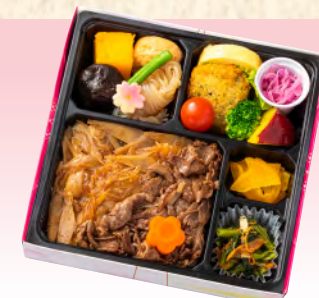
No.938 牛めし幕の内弁当 19.5×19.5cm 税込 1,540 円 (本体価格 1,400 円)