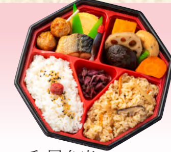
No.943 和風弁当 20.5×20.5cm 税込 935 円 (本体価格 850 円)