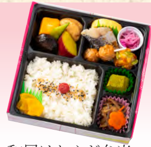
No.919 和風はなやぎ弁当 19.5×19.5cm 税込 1,210 円 (本体価格 1,100 円)