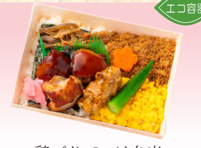
No.926 鶏づくしのつけ弁当 17.7×12.0cm 税込 990 円 (本体価格 900 円)