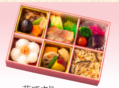
No.902 花てまり 23.6×15.8cm 税込 1,870 円 (本体価格 1,700 円)