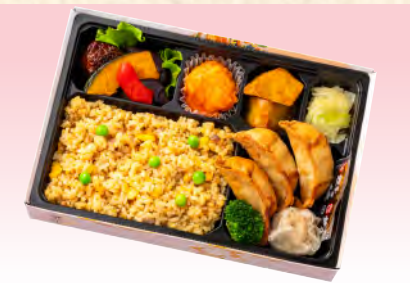
No.918 中華風幕の内弁当 27.6×18.2cm 税込 1,430 円 (本体価格 1,300 円)