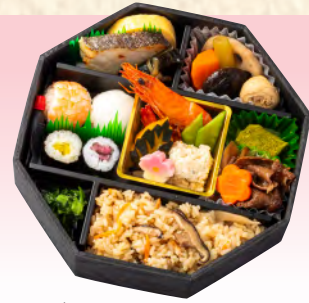
No.911 匠 20.5×20.5cm 税込 2,530 円 (本体価格 2,300 円)