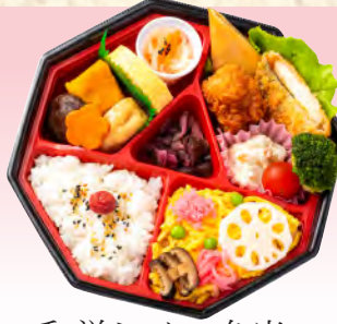
No.925 和洋ミックス弁当 20.5×20.5cm 税込 990 円 (本体価格 900 円)