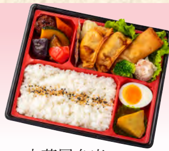
No.924 中華風弁当 23.0×20.0cm 税込 990 円 (本体価格 900 円)