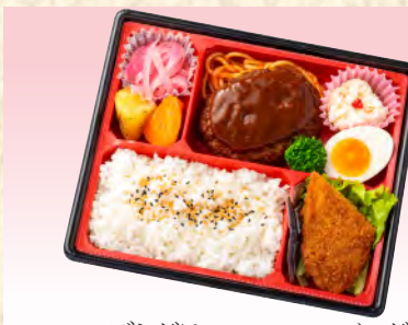
No.923 デミグラスソースハンバーグ弁当 23.0×20.0cm 税込 990 円 (本体価格 900 円)