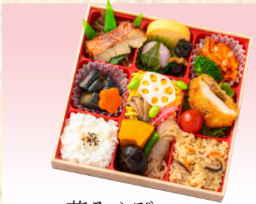
No.904 花みやび 19.5×19.5cm 税込 1,430 円 (本体価格 1,300 円)