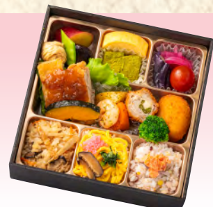
No.914 花いろは 18.3×18.3cm 税込 1,650 円 (本体価格 1,500 円)