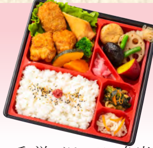
No.942 和洋バラエティ弁当 22.8×22.8cm 税込 990 円 (本体価格 900 円)