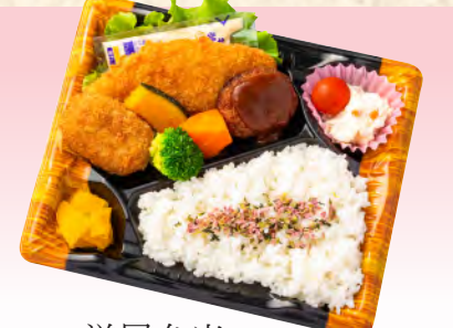
No.927 洋風弁当 23.4×19.4cm 税込 935 円 (本体価格 850 円)