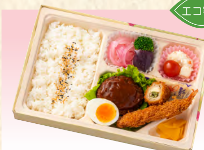
No.917 洋風幕の内弁当 27.6×18.2cm 税込 1,430 円 (本体価格 1,300 円)