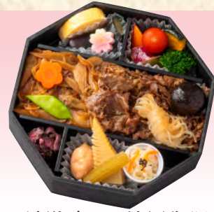
No.905 淡路牛すき焼風御膳弁当 20.5×20.5cm 税込 2,530 円 (本体価格 2,300 円)