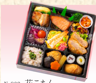
No.903 花こもん 21.4×21.4cm 税込 1,870 円 (本体価格 1,700 円)