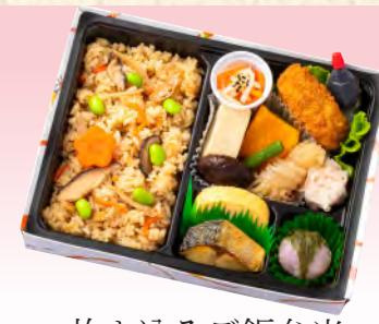
No.921 炊き込みご飯弁当 21.6×16.5cm 税込 1,100 円 (本体価格 1,000 円)