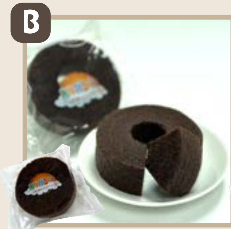
★ありがとうバウム (チョコ)

こだわり卵の卵黄の濃い色が生地にも反映されたふんわりやわらかなくちどけのバウムクーヘン