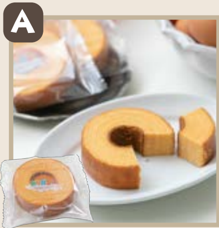
★ありがとうバウム (プレーン)

下記のバウムクーヘンA～Dよりお好きなバウムクーヘン3種をお選び頂き、かわいいプチボックスにセットさせていただきます。