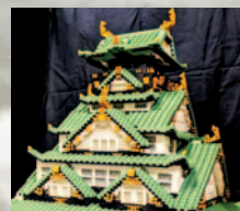
※こちらは阪大レゴ部の展示作品です

阪大レゴ部によるワークショップ! 手のひらサイズのお城を ブロックで組み立てよう!!