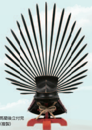
馬籠後立付兜 (複製)